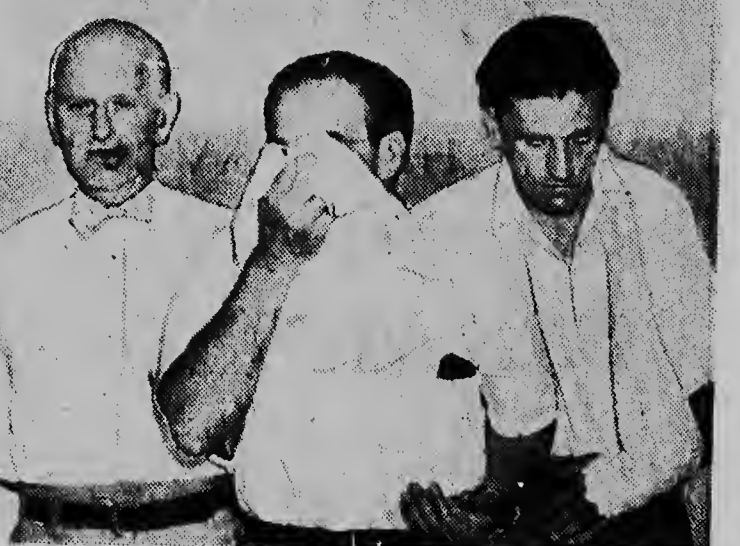
De F.B.I. heeft de geheimzinnige aanslag op de radio- en dagblad-journalist Victor Riesel opgehelderd. Op 5 april werd hij, bij het verlaten van de studio, door een man benaderd die hem zwavelzuur in de ogen gooide. Riesel moest beide ogen missen. De F.B.I. heeft vijf personen aangehouden, die het complot hebben gesmeed (twee van de vijf toont de onderste foto). De dader is overigens vermoord, toen hij inplaats van de $ 500.— die hem beloofd was, $ 50,000 troef.